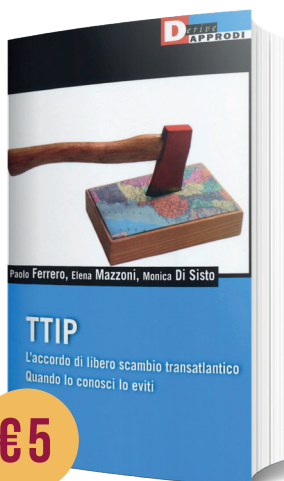
TTIP. L'ACCORDO DI LIBERO SCAMBIO TRANSATLANTICO di P. Ferrero, E. Mazzoni, M. Di Sisto