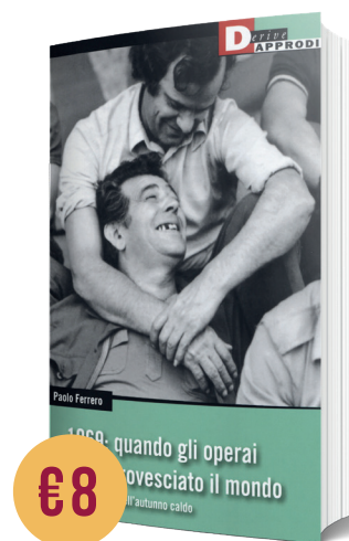
1969: QUANDO GLI OPERAI HANNO ROVESCiato IL MONDO di Paolo Ferrero