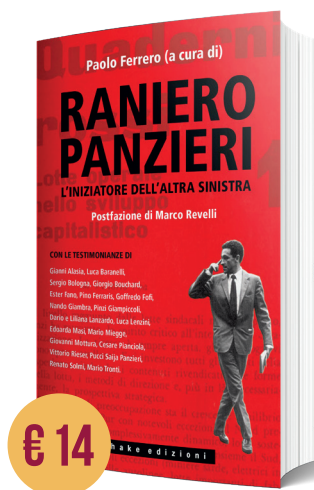
RANIERO PANZIERI, L'INIZIATORE DELL'ALTRA SINISTRA a cura di Paolo Ferrero