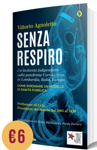
SENZA RESPIRO di Vittorio Agnoletto