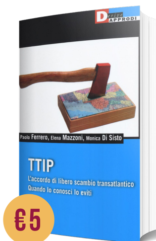
TTIP. L'ACCORDO DI LIBERO SCAMBIO TRANSATLANTICO di P. Ferrero, E. Mazzoni, M. Di Sisto