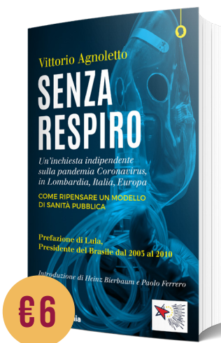
SENZA RESPIRO di Vittorio Agnoletto