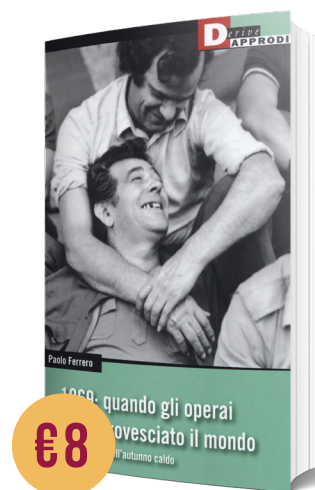
1969: QUANDO GLI OPERAI HANNO ROVESCiato IL MONDO di Paolo Ferrero