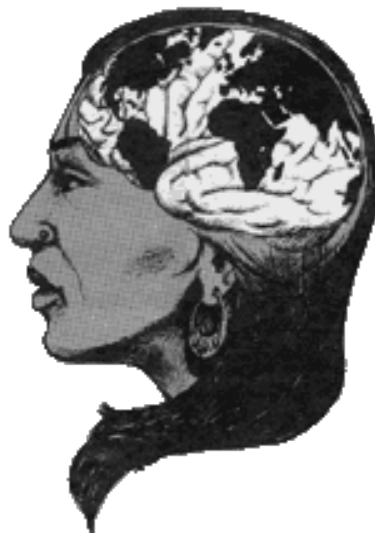
"Il pensiero della follia"

A ciascuno il suo farmaco, naturalmente.