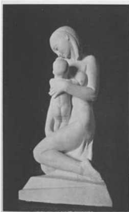
Salone delle adunanze: Particolare. Boccioni - AMOR MATEENO.

fare a meno di servirsi di interventi "terapeutici" pur nella coscienza del precario fondamento degli interventi stessi. In altre parole: non abbiamo bisogno di una psichiatria che faccia sempre meglio, ma di una psichiatria che si faccia continuamente domande sul senso del fare.