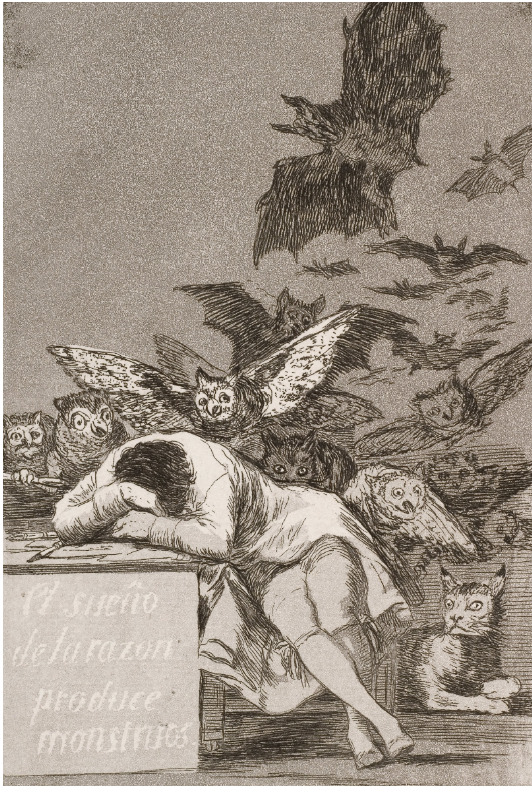
Goya, Il sonno della ragione genera mostri