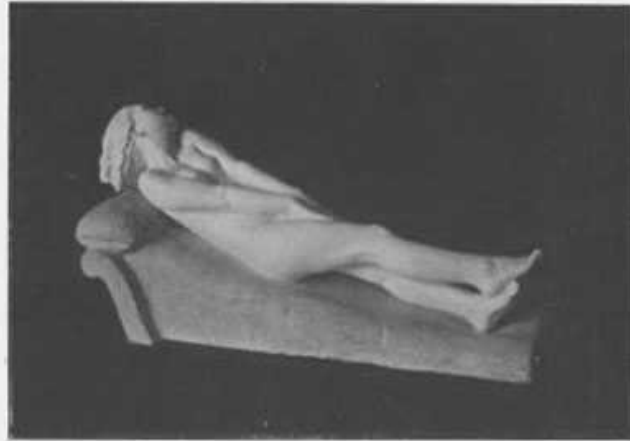
Salone delle adunanze: Particolare. Boccioni - SOGNO.