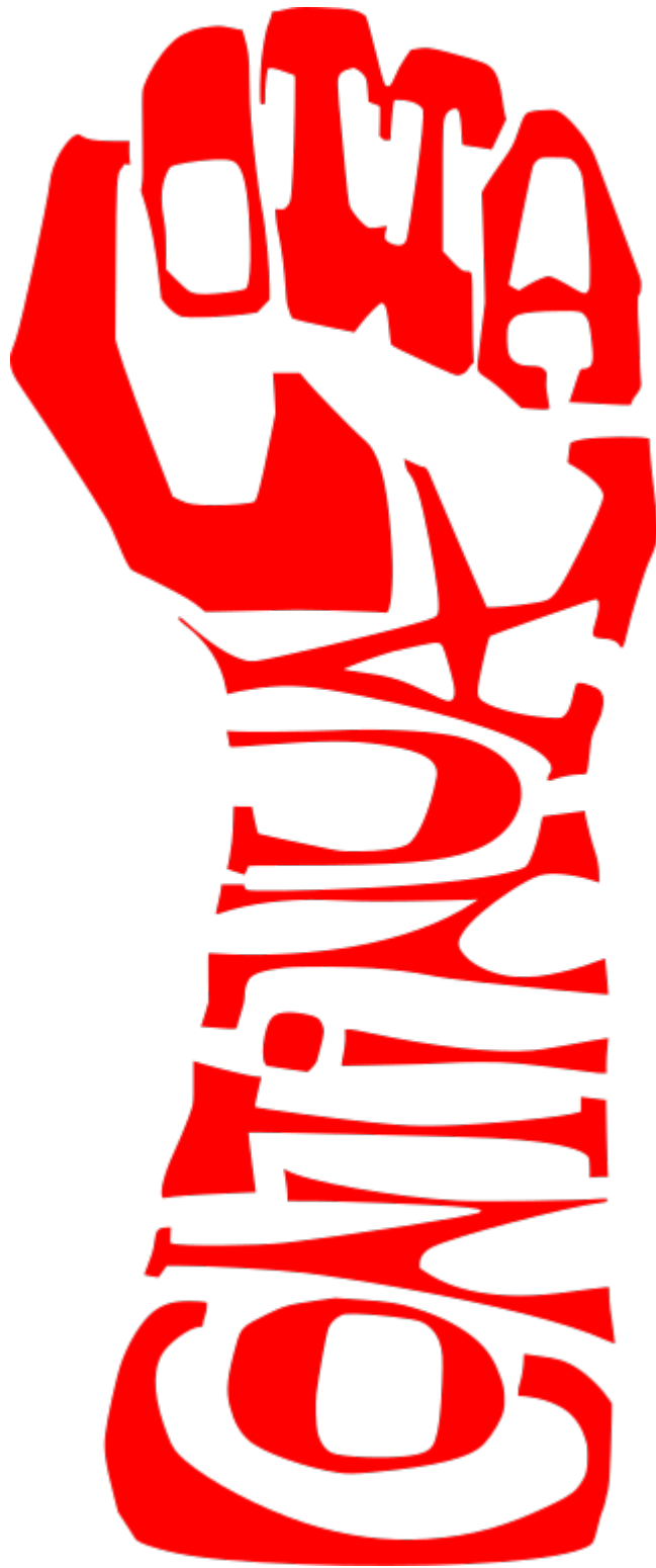
Simbolo di Lotta Continua.