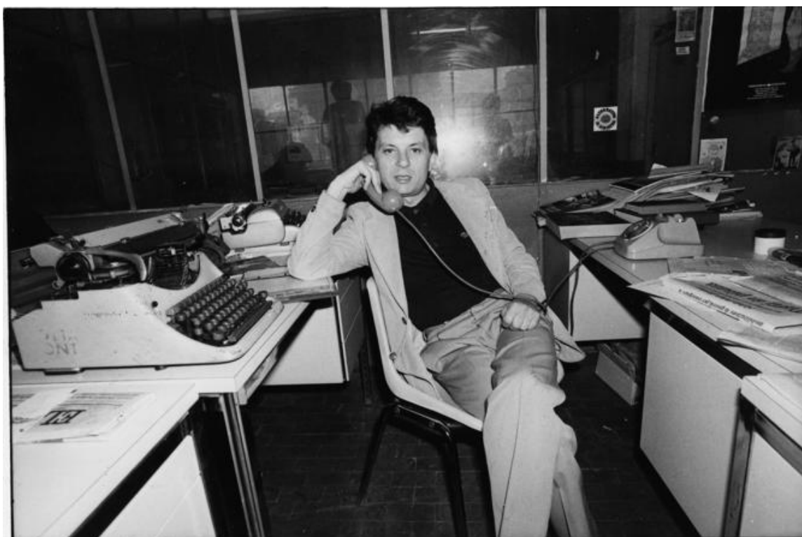
Adriano Sofri nella redazione di Lotta Continua.

Aggressivo e stimolante nel formato, nella grafica, nell'uso spregiudicato di foto e fotomontaggi, di vignette irriverenti, scritto con un linguaggio diretto, a volte enfatico, immaginifico e un po' retorico, aveva comunque un impatto informativo e propositivo notevole. Colpiva fin dall'inizio la crudezza e l'efficacia di certi titoli, diretti, immediati, senza possibilità di interpretazioni ambigue, privi, come gli articoli d'altronde, delle formalità e dei giri di parole del linguaggio politico, sindacale e perbenista. Emergeva invece il piacere di essere irriverenti, di colpire con le parole e le descrizioni il lettore per suscitare subito una reazione immediata.