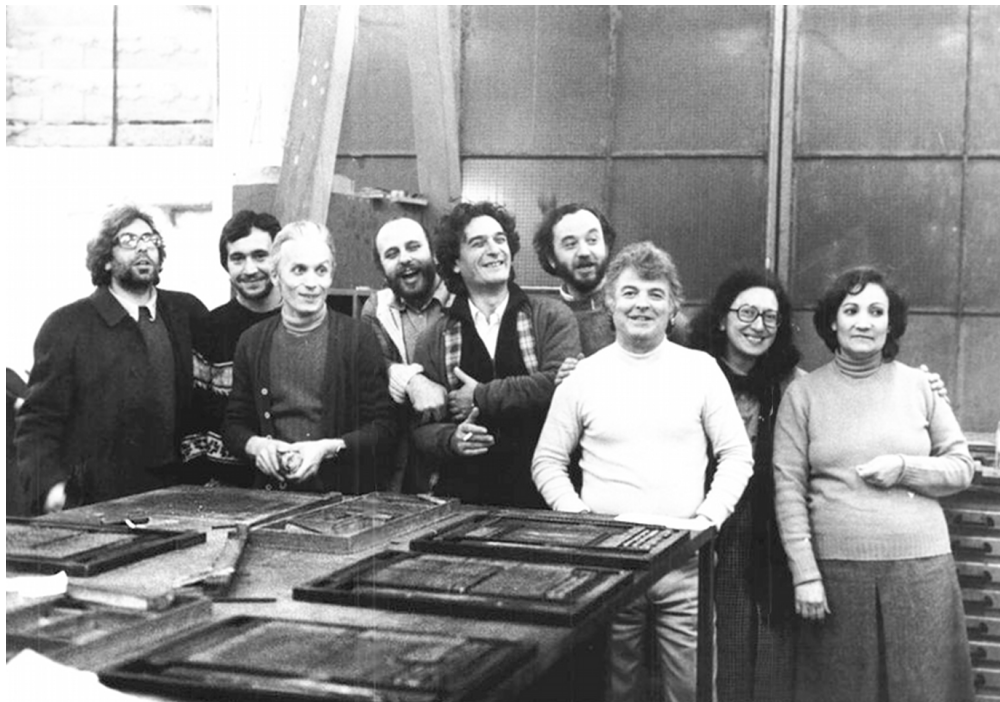
Redazione del quotidiano Lotta Continua - 1970