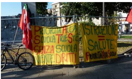
Presidio contro il G7 dell'istruzione, Trieste Piazza della Libertà 28 giugno (redazione)

Seguono firme di numerose/i insegnanti e le adesioni di altri partiti, movimenti e associazioni. Alla manifestazione, in una Trieste ridicolmente blindata per il contemporaneo incontro dei ministri dell'istruzione del G7, hanno partecipato circa 150 attiviste/i.