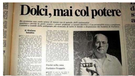
Un titolo significativo su Danilo Dolci (L'Ora, 11 febbraio 1974)