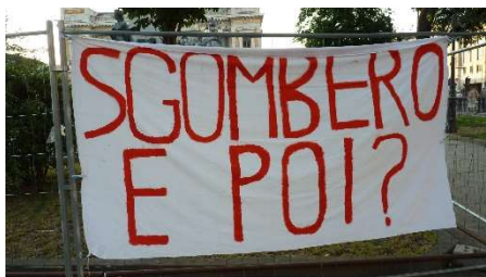
Una scritta in Piazza della Libertà, 28 giugno

mondo, ne siamo stati spossessati. Avere fiducia nel mondo vuol anche dire suscitare eventi, per piccoli che siano, che sfuggano al controllo, oppure dare vita a nuovi spazi-tempi, anche di superficie e volumi ridotti”.