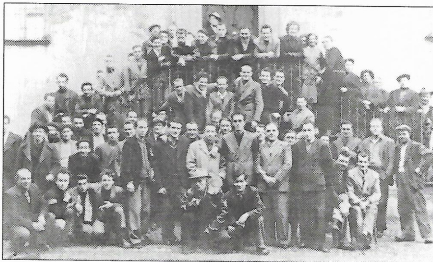
Operai Falci dopo la conclusione dello sciopero dei "Pumet" - primavera '54