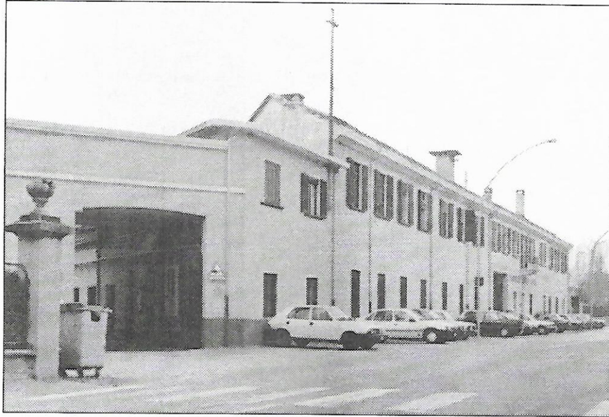
Lo stabilimento Falci